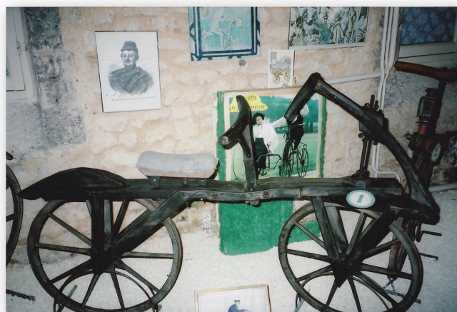
Fig 3 - La draisienne du musée Vélorama de Nimègue.