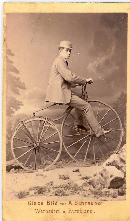
Fig 6