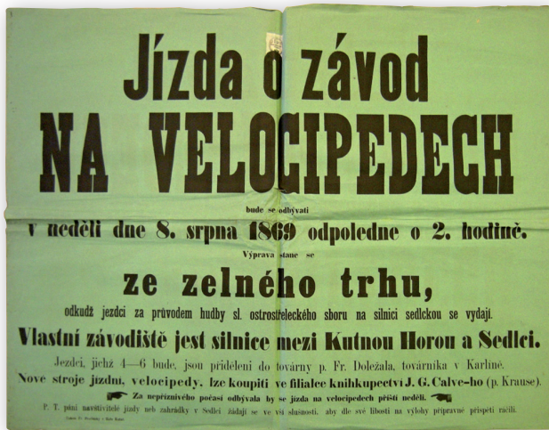
Fig 4 - Poster inviting for the velopedede races on August 8, 1869 in Kutná Hora