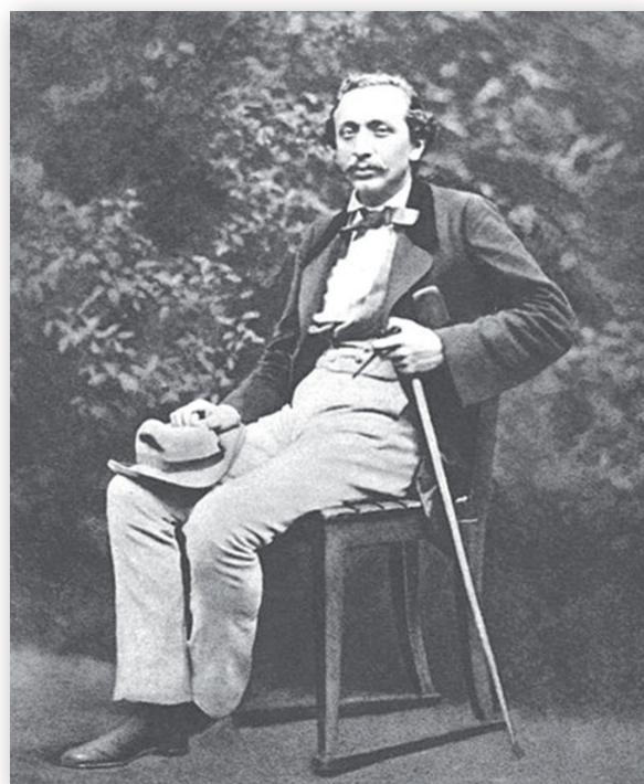
Fig 1 - Jan Neruda (July 9, 1834 - August 22, 1891)

A number of interesting facts follow from the text. To begin with, that a boneshaker caused a serious injury on the floor of a theatre, quite possibly the very first of its kind. The Viennese actor Franz Tewele was famous for this. The accident happened on the stage of the Viennese Carltheater on Thursday 28 January 1869 at about four o'clock in the afternoon. Tewele (1) wanted to try out a scene with an acrobatic stunt on a boneshaker, which he planned to present at the evening première of the operetta Le château à Toto by Jacques Offenbach. He ended